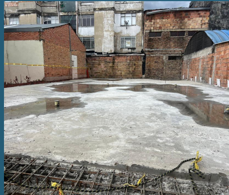
Fundida placa 2do piso, sector sur-oriental

Actividades que evidencian el desarrollo de la estructura del edificio con la construcción de parte de la placa del segundo piso.