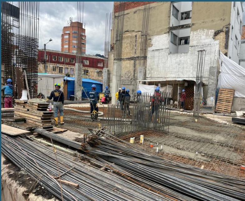
Vaciado de placa 1er piso

Se dio inicio a la construcción de placas del 1er piso