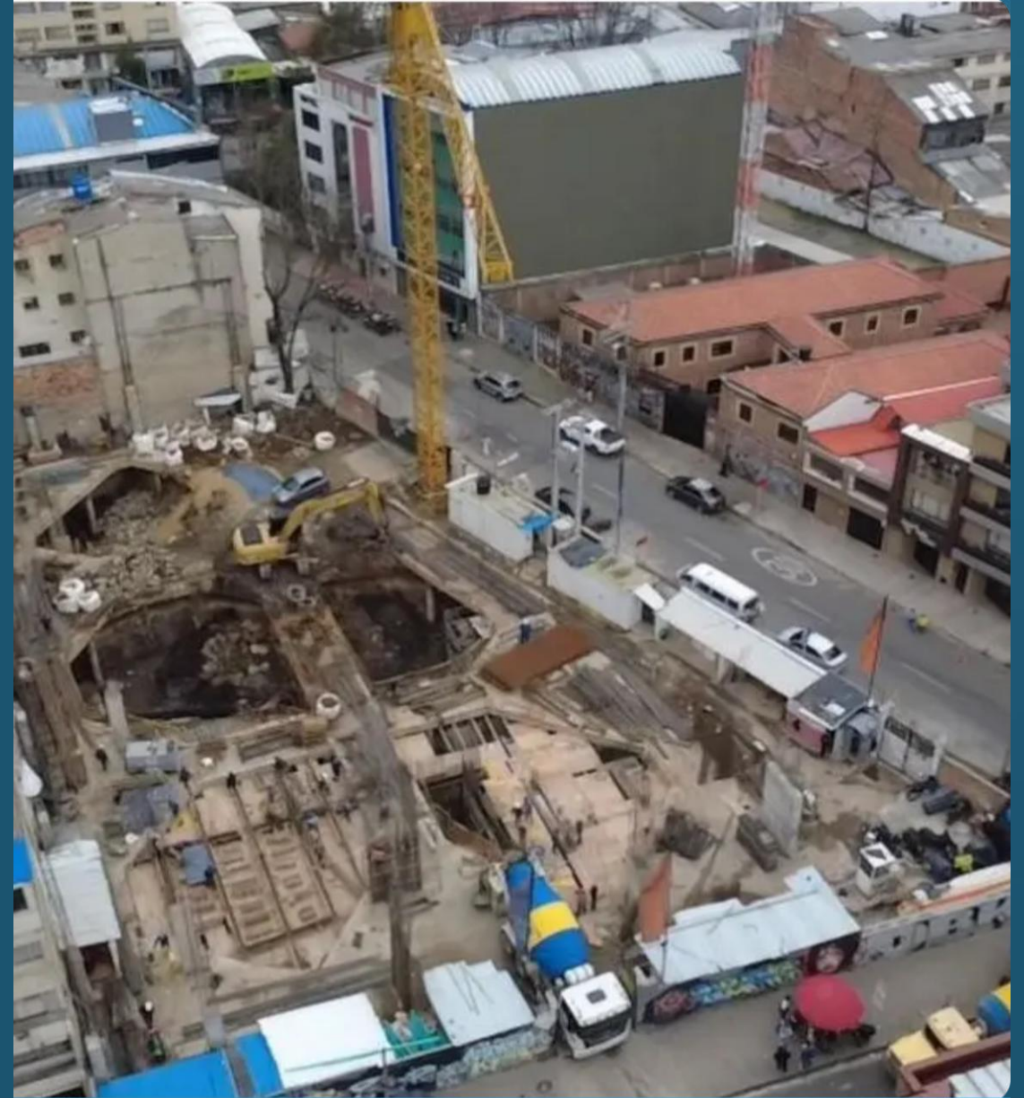
Armado y fundida placa de 1er piso

El proyecto Orion Distrito Vertical avanza con firmeza, superando hitos críticos en la fase de cimentación y estructura inicial.